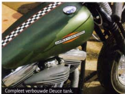
Compleet verbouwde Deuce tank.