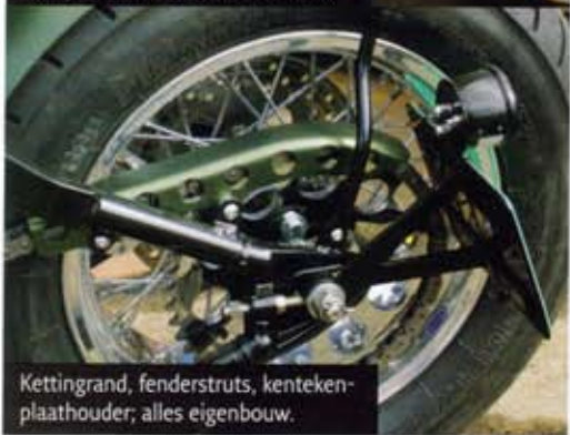
Kettingrand, fenderstruts, kentekenplaatouder; alles eigenbouw.