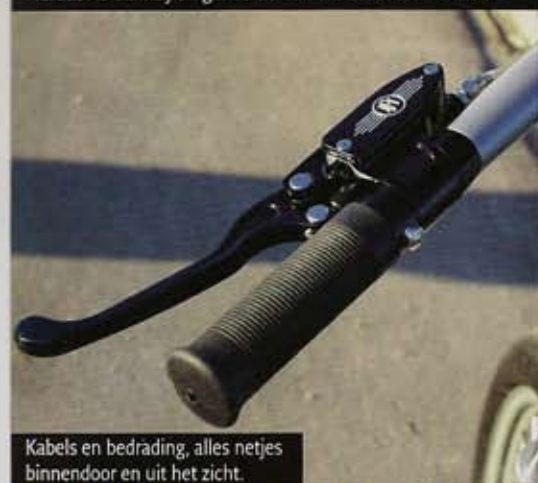
Kabels en bedrading, alles netjes binnendoor en uit het zicht.