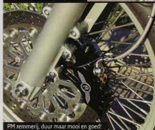
PM remmerij, duur maar mooi en goed!