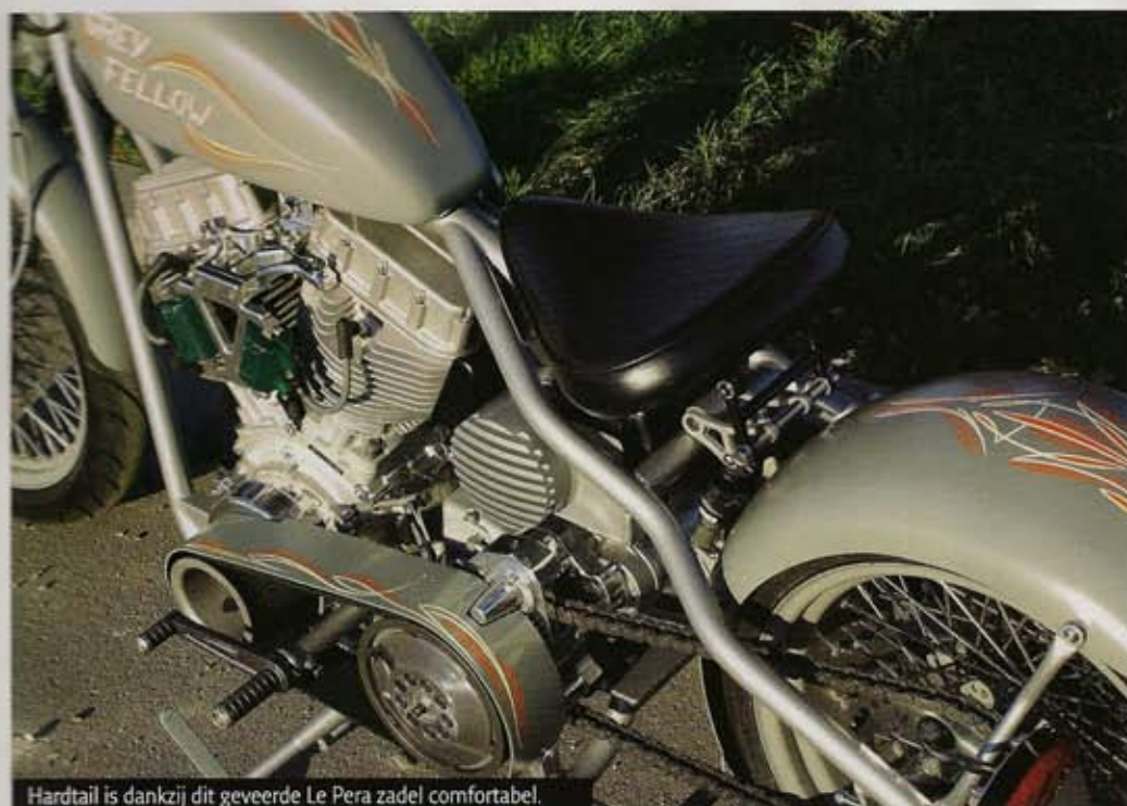
Hardtail is dankzij dit geveerde Le Pera zadel comfortabel.