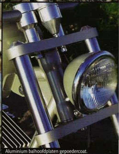
Aluminium balhoofdplaten gepoedercoat.