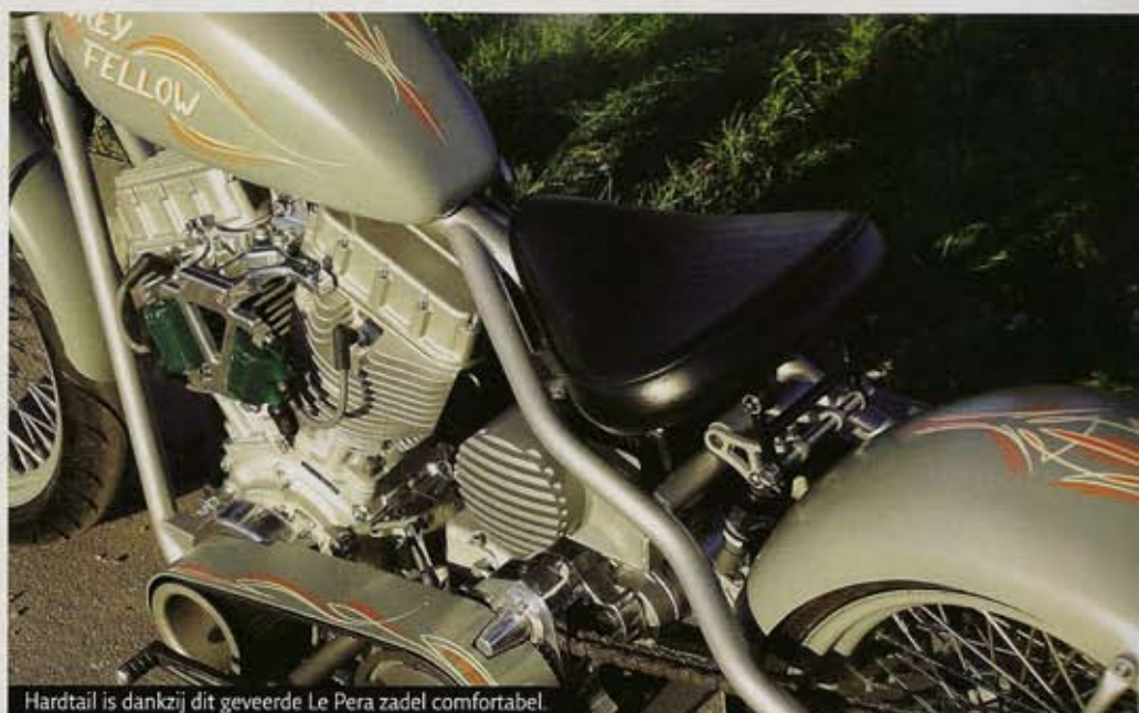
Hardtail is dankzij dit geveerde Le Pera zadel comfortabel.